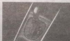
Advanced Automatic Transmission (CVT) Smart Hybrid Technology