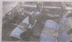
Lavish Cabin Space