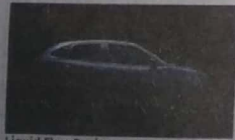
Liquid Flow Design